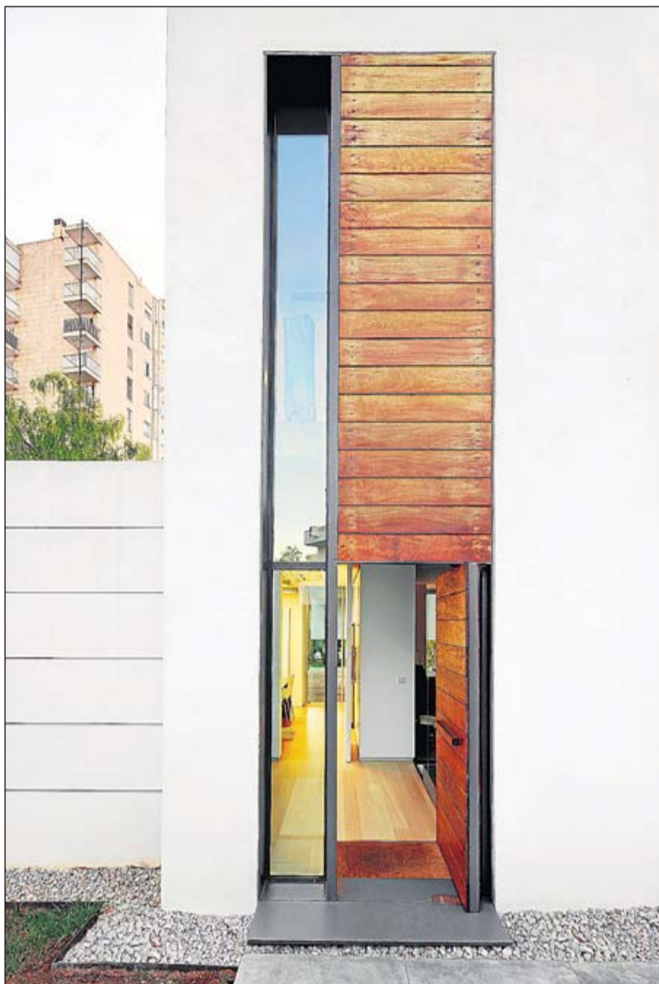
La entrada a la vivienda se encuentra en la unión de los dos volúmenes.