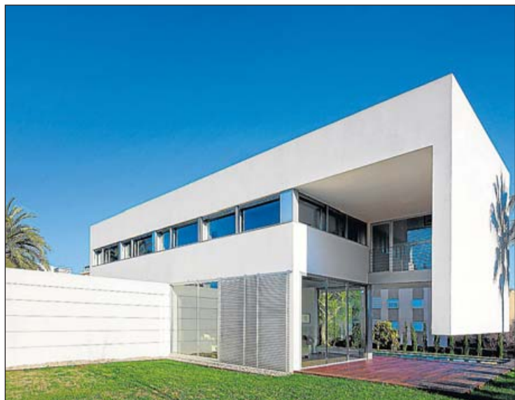
Salón y porche se abren para disfrutar del jardín.