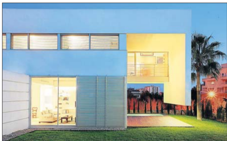
Un muro colgado y las dos plantas de la casa.