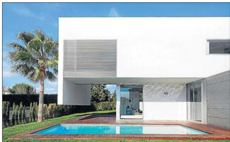
Jardín de la casa, con la piscina en primer plano.