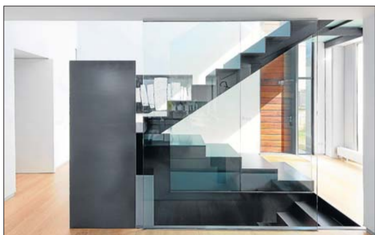
Escalera de acceso al primer piso.