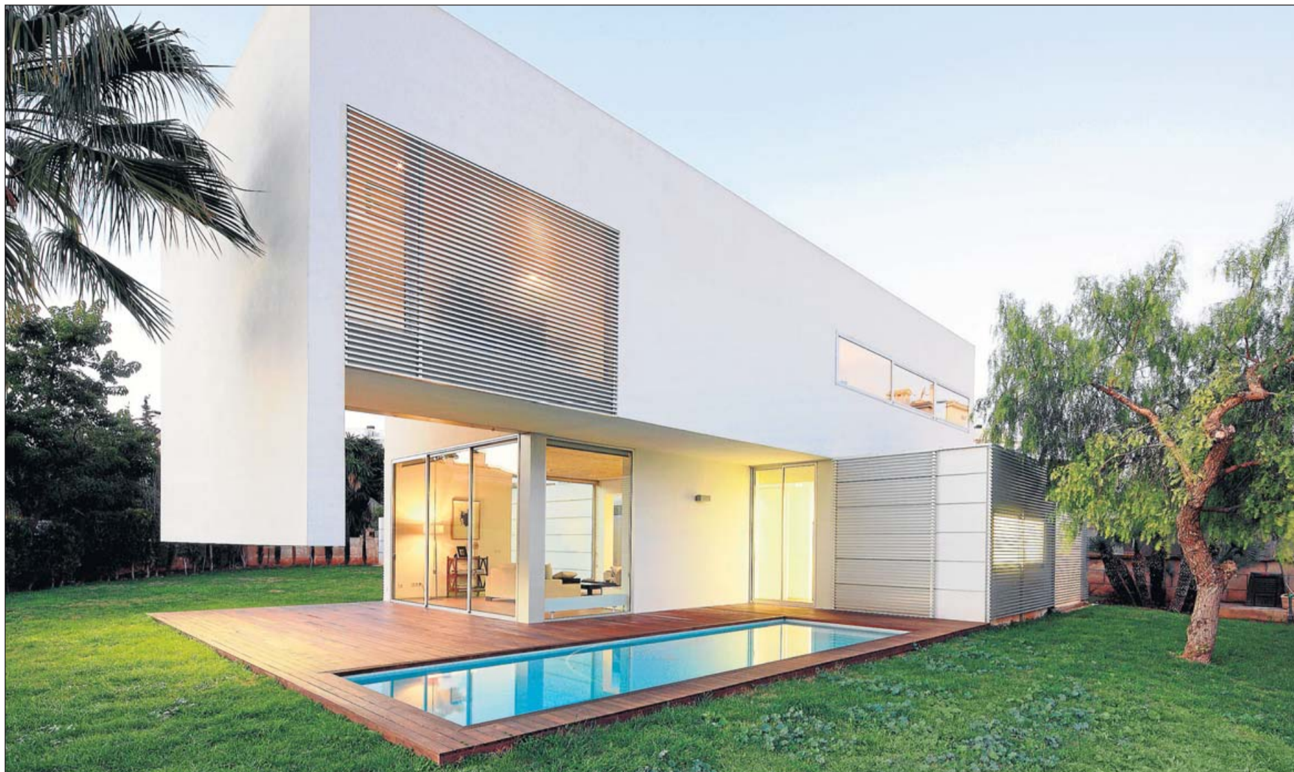
Una casa en forma de 'L' que se abre hacia el jardín.